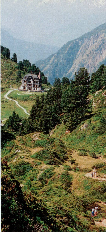
Die Villa Cassel auf der Riederalp ist das erste Pro-Natura-Zentrum in der Schweiz.

Bei der ersten Abzweigung Richtung Blausee und Bettmeralp wandern wir geradeaus weiter. Erst bei Biel auf rund 2300 Meter Höhe, wo auch das Naturschutzgebiet Aletschwald zu Ende ist, folgen wir dem Bergweg über den Grat Richtung Bettmeralp. Einen letzten Blick werfen wir auf den Gletscher, den letzten Rest Tee trinken wir aus der Flasche. Danach lassen wir die Stille des Aletschwaldes hinter uns und tauchen wieder ein in die Welt von Touristen, Feriengästen und Ausflüglern: Vorbei am Blausee und am Bettmersee, über Wiesen voller Enziane, Alpenveilchen, Berganemonen und ersten Alpenrosen, steigen wir hinunter auf die Bettmeralp.