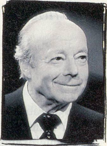
Heute von Heinz Rühmann.