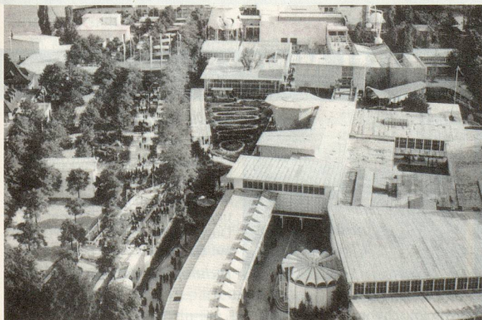
Die so genannte Landi 1939 in Zürich gilt als Inbegriff der bisherigen fünf Landesausstellungen.

Für Schlagzeilen sorgte das grossangelegte und umstrittene «Gulliver»-Projekt, das die Volksmeinung zu Emanzipation, Dienstverweigerung, Bodenspekulation oder Kommunismus erhob. Die Umfrage wurde von vielen gerne und ausführlich beantwortet, dann aber zensuriert. Von publizierten Ergebnissen war keine Rede. ■