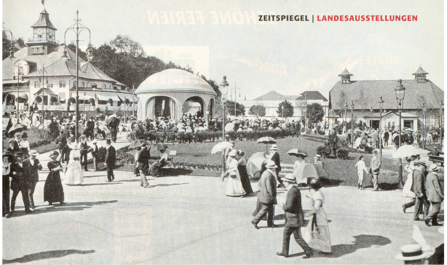
Trotz Kriegsausbruch wollte der Bundesrat 1914 die Weiterführung der dritten Landesausstellung in Bern.

Franken zeugen davon. Der Wirtschaft im Land ging es wieder etwas besser, das zeigten auch die stark gesunkenen Arbeitslosenzahlen, die 1936 noch bei fünf Prozent lagen. Vorboten des Krieges aber waren bei der Eröffnung im Mai bereits in der Luft. Bundespräsident Etter bezeichnete die Landi in seiner Eröffnungsrede als «Kundgebung unseres Willens, mutig und mit Vertrauen in die Zukunft zu blicken». Verbunden mit dem Wunsch: «Und sie möge in ihrer Gesamtheit Zeugnis ablegen für unser unabhängiges, einiges und starkes Volk, für unser durch seine Vielheit reiches Volk.»