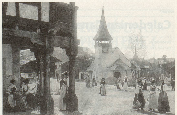
Ländliche Idylle und heimelige Kulissen im «Village suisse» begeisterten 1896 in Genf.