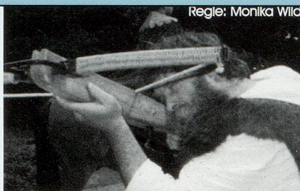
Regie: Monika Wild

Jeden Donnerstag vom 21. Juni bis 6. Sept. Jeden Samstag vom 28. Juli bis 8. Sept. Spielbeginn jeweils 20.00 Uhr Achtung! An der Nachmittagsvorstellung vom 22. Juli geniessen Personen im Rentenalter 50% Ermässigung! Spielbeginn 14.30 Uhr