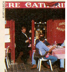
Im Bistro auf dem Montmartre – Paris ist immer eine Reise wert.

Die Zeitlupe im Mai ist ein grosser Blumenstrauss. Geniessen Sie die schönen Texte und Bilder. ■