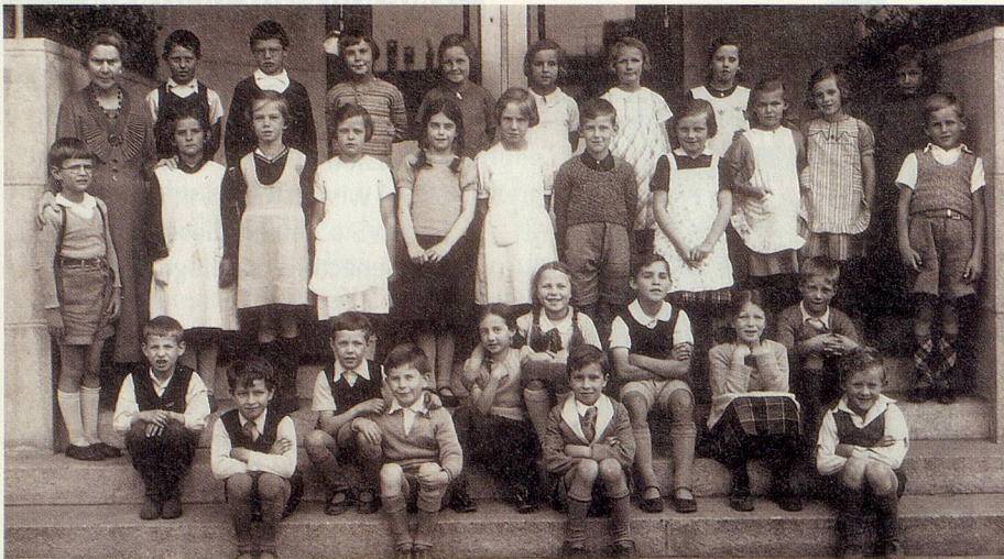
Klassenfoto der Primarschule Länggasse Bern.