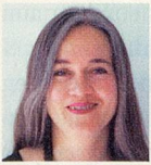
FÜR MEINE FREUNDIN CAMILLA VON MARTINA ISSLER, FOTOGRAFIN

Mütter sollten ihren Kindern von der Bedeutung der Träume erzählen», sagte Tante Habiba. «Sie geben ein Gefühl für die Richtung. Es reicht nicht, das Leben im Hof zu verabscheuen, man braucht eine Vision von den Wiesen, gegen die man den Hof eintauschen will. Aber wie erkennt man die eine Sehnsucht, auf die man sich konzentrieren sollte, den wirklich wichtigen Traum, der einem eine Vision gibt?» Fatima Mernissi, 1940 in einem Harem in Fès, Marokko, geboren, erzählt auf feinfühligste Art die Geschichte ihrer Kindheit, beschreibt die Kraft der Sehnsucht und die sichtbaren und unsichtbaren Grenzen des Lebens im Harem. Tante Habiba antwortete Fatima Mernissi, die heute als Professorin in Rabat Soziologie lehrt: «Mach dir keine Gedanken, du entstammst einer Kette von Frauen mit starken Träumen.» > FATIMA MERNISSI, DER HAREM IN UNS , HERDER VERLAG, FREIBURG, 294 S., FR. 21.–