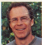
FÜR MEINE MUTTER VON RETO BAER, FILMKRITIKER

Die Zeitlupe-Redaktion, ihre freien Journalisten und Fotografinnen und der Herausgeber schenken zu Weihnachten Bücher.