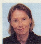
FÜR MEINE FREUNDIN CHRISTINA VON ERICA SCHMID, REDAKTORIN

D ie Erzählungen des Aargauers Klaus Merz, die ich dir, lieber Bruder, unter den Christbaum lege, sind Miniaturen: präzise Miniaturen, die sich, so scheint es auf den ersten Blick, an der Oberfläche des Lebens bewegen – die aber, lässt man sich wirklich auf sie ein, versteckte Bedeutungskammern, verstecktes Unglück und verstecktes Glück erahnen lassen. Merz ist einer, der eine karge Sprache als reiches Ausdrucksmittel einzusetzen vermag. Dadurch kann er sich grossen Lebensthemen nähern, ohne diese durch Bedeutungsschwere zu erdrücken. Seine jüngsten Erzählungen berichten von Begegnungen, von Nähe und Distanz – von den kleinen Augenblicken, in denen sich die Wege zweier Menschen kreuzen und in denen sie etwas von dem Leben, was zwischen ihnen möglich ist – und anderes lassen und verpassen. > KLAUS MERZ, ADAMS KOSTÜM , HAYMON VERLAG, INNSBRUCK, 92 SEITEN, FR. 28.–