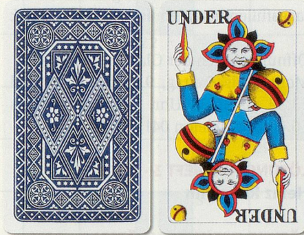
Der Schmaus nach dem Verteilen: links Stock, rechts Trumpfkarte.

Obenabe und Undenufe werden beim Schmaus nicht gespielt. Es gelten die bekannten Weisregeln. Solange Karten aufliegen, darf bei jedem Stich gewiesen werden: Dreiblatt von einem Ober (einer Dame), drei vom König, drei vom Ass und schlussendlich 100 vom Ass. Es darf jedoch in der gleichen Grösse nie abwärts gewiesen werden. Wer 50 von einem Under (vom Buben) gewiesen hat – Achter, Neuner, Banner (Zehner), Under (Bube) – und den Siebner aufnimmt, muss 100 vom Under weisen, also nicht mehr Dreiblatt vom Neuner, 50 vom Banner.