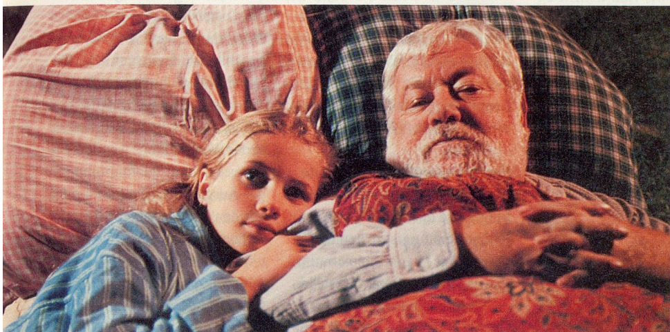
Heidi (Cornelia Gröschel) kann das Herz ihres Grossvaters (Paolo Villaggio) öffnen.

Am kommenden 7. Juli jährt sich der Todestag von Johanna Spyri zum hundertsten Mal. Jetzt kommt ein neuer «Heidi»-Film in unsere Kinos – mit vielen Veränderungen zum Buch.