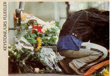
Trauernde, Blumen und Kränze vor dem Zuger Parlamentsgebäude.

Viel Freude bei der Lektüre wünsche ich Ihnen. ■