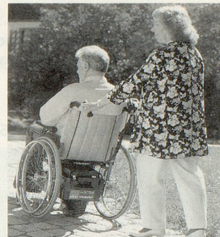
VIAMOBIL – einfache Schiebehilfe

Service-Center, 8637 Laupen ZH Telefon 055 246 46 44