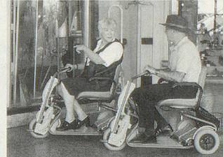
SUPERLIGHT, der tragbare SCOOTER.

«Beweglichkeit spielt in unserem Leben eine tragende Rolle»