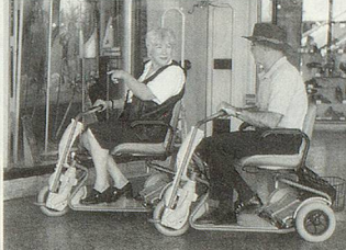
SUPERLIGHT, der tragbare SCOOTER.

«Beweglichkeit spielt in unserem Leben eine tragende Rolle»