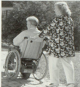
VIAMOBIL – einfache Schiebehilfe