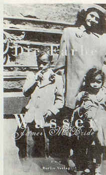
James McBride Die Farbe von Wasser Erinnerungen Berlin Verlag, Berlin, 315 S., Fr. 38.–