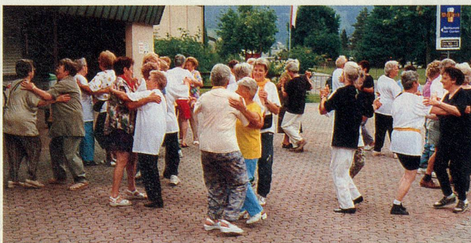
Impressionen der 4. Sport- und Begegnungstage 1999.