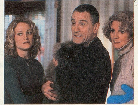
Greg will Pam (Teri Polo, links) heiraten. Aber will er auch zum Schwiegersohn von Jack (Robert De Niro) und Dina (Blyth Danner) werden?