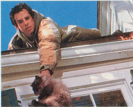
Während Greg (Ben Stiller) eine Katastrophe verhindern will, bahnt sich schon die nächste an: Seine Zigarette entzündet das Laub in der Dachrinne.