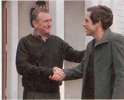
Die Begegnung mit seinem zukünftigen Schwiegervater (Robert De Niro, links) macht Greg (Ben Stiller) nervös.