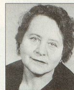
Lisa Tetzner 633 Lösungen, 16 falsch

«Danke, dass Sie mich wieder einmal auf diese grossartige Frau hingewiesen haben. «Die schwarzen Brüder» halfen seinerzeit mit, in mir als Heranwachsender das soziale Gewissen auszubilden und die Welt realistischer zu sehen.» Dies schreibt eine Leserin im Kommentar zur eingesandten Lösung und trifft damit den Nagel auf den Kopf. Denn genau das wollte Lisa Tetzner mit ihrem literarischen Schaffen erreichen. Sie verstand es, in ihren Büchern märchenhafte Elemente mit sozialkritischen Zügen zu vereinen und die Kinder auf diese Weise nicht nur zu unterhalten, sondern auch zu sozialer Verantwortung zu erziehen. Zu Lebzeiten erhielt sie dafür allerdings wenig Dank: Sie galt als «Nestbeschmutzerin» roter Couleur. Heute zählt sie zu den wichtigsten Persönlichkeiten der Kinder- und Jugendliteratur aus der Nachkriegszeit. ytk