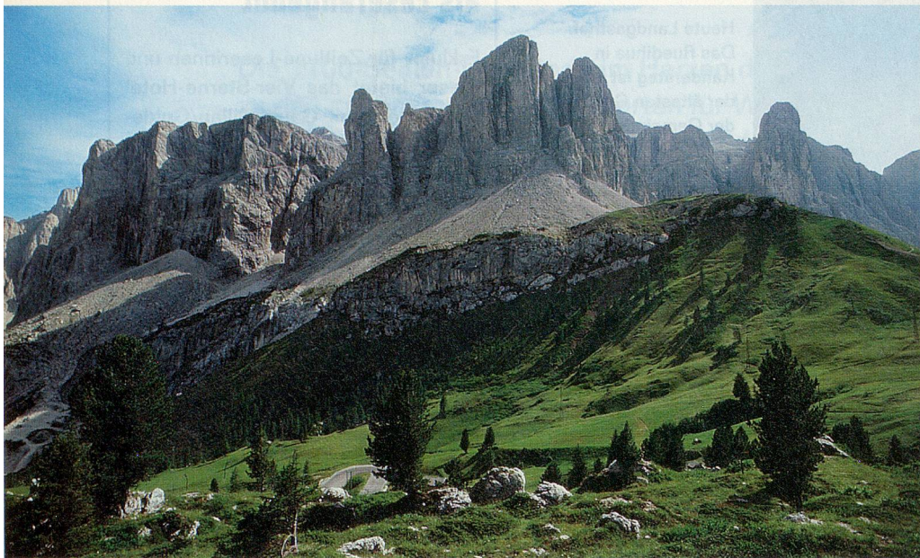
Die Jubiläumsreise des Schweizerischen Invalidenverbands führt ins Südtirol – mit einem Abstecher zu den Dolomiten.