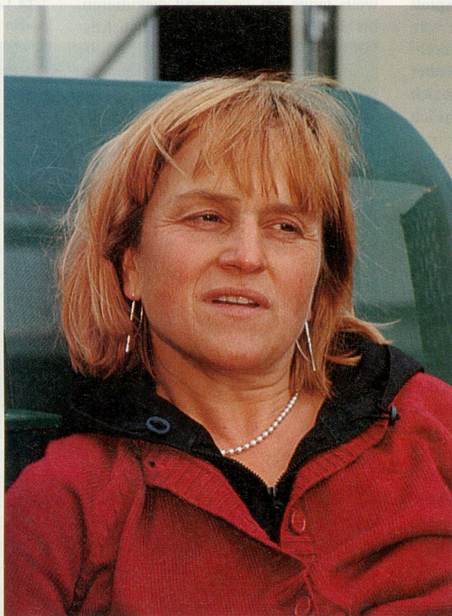
Meine Figur Hanna hat etwas Wildes, etwas relativ Böses, gemischt mit viel Rührendem.

Das Schlimmste ist, wenn man mich einseitig wahrnimmt. Wie eine Schreckfigur. Ich werde einseitig dargestellt und man sieht mich dann auch nur so. Obwohl ich doch ein Mensch mit ganz vielen Schattierungen bin. Aber damit muss ich leben. Denn wenn man sich als Kunstfigur hergibt, ist man natürlich auch eine Projektionsfläche. Eine