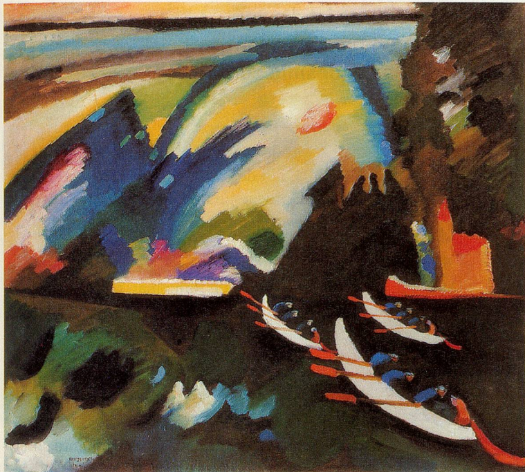
Das Ölbild «Der See» malte Vassily Kandinsky 1910, in der Übergangsphase von der gegenständlichen zur abstrakten Kunst.

«Punkt und Linie zu Fläche» heisst das kunsttheoretische Standardwerk Vassily Kandinskys aus dem Jahre 1926. Wie sich Punkte und Linien zu Flächen und wie sich gegenständliche Bilder zu gegenstandslosen entwickelten, kann man gegenwärtig in einer Ausstellung in der Fondation Pierre Gianadda in Martigny miterleben. Der Schritt zur Abstraktion begann mit Kandinskys frühen, von der russischen Folklore beeinflussten Werken, entwickelte sich weiter in expressionistischen, leidenschaftlich bunten Landschaften und gipfelte in den grossformatigen abstrakten «Kompositionen» zwischen 1910 und 1913. In diesen Schlüsselwerken der Kunst des zwanzigsten Jahrhunderts gab Kandinsky die Zentralperspektive, eine Erfindung der Renaissance, zu Gunsten einer neuen Sicht der Dinge auf. «Poetische Perspektive» kann man es nennen, wenn er Linien und Flächen zu Farb- und Formräumen verschmelzen lässt. Einerseits abstrahiert Kandinsky die konkrete Welt zu reinen Farb- und Formkompositionen; andererseits lässt er uns in diesen Bildern des Farben- und Formenspiels unverhofft Fragmente von Menschen, Tieren und Landschaften