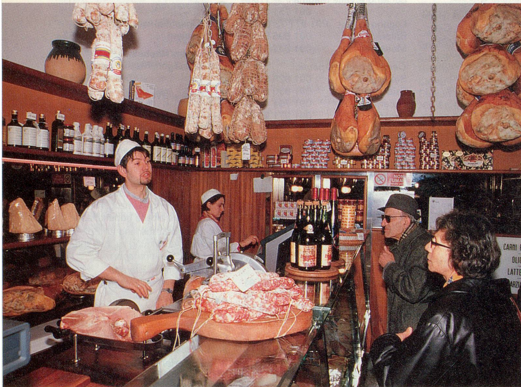
Von hier kommt der berühmte Parma-Schinken: typische Salumeria in Parma.

Wer kennt nicht den feinen Prosciutto di Parma oder den aromatischen Parmigiano? Doch die Stadt in der Emilia Romagna, deren Namen diese kulinarischen Köstlichkeiten tragen, hat weit mehr zu bieten. Sie ist ebenso ein geschichtsträchtiger Ort der Kunst, der Architektur und der Musik.