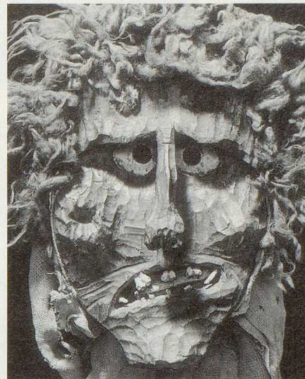
Eine der urchigen Lötschentaler Masken aus der Sammlung des Rietbergmuseums Zürich.

Sie gilt weithin als archaisches, ge- wissermassen urschweize- risches