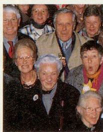
Foto mit Ihrem Namen und Ihrer Adresse ein. Damit nehmen Sie an einer Verlosung teil und haben die Chance, einen der folgenden Preise zu gewinnen: eine Woche Wanderferien in Zuoz, einen Baumeler-Reisegutschein im Wert von 500 Franken oder eine Fahrt mit dem Pro-Senectute-Heissluftballon. Wir freuen uns auf Ihre Konterfeis! Weitere Bilder vom AHV-Fest finden Sie auf den Seiten 20 und 21.

W aren Sie am 21. November 1998 am AHV-Fest in Bern? Haben Sie sich auf dem Titelbild dieser ZEITLUPE wieder erkannt? Das Foto wurde in der BEA-Halle aufgenommen und ist mit einem Wettbewerb verbunden. Wenn Sie zu der illustren Gruppe auf unserem Titelbild gehören, schicken Sie uns ein persönliches