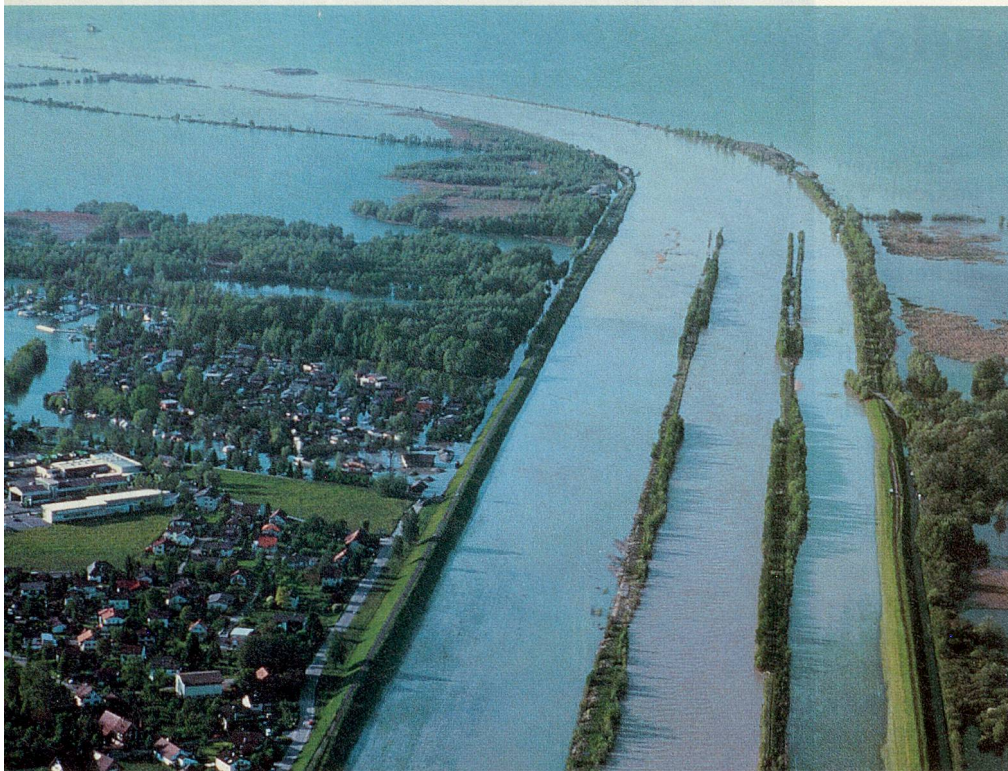
Rheinmündung am Bodensee nach den grossen Niederschlägen am 23. Mai 1999.

gust vermieste. An diesem Tag herrschte in Mitteleuropa grossräumig sehr schlechtes Wetter, sodass das Jahrhundertereignis der verfinsterten Sonne nur durch einige rare Wolkenlücken