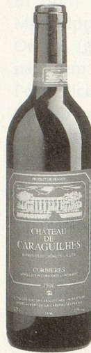
Château Caraguilhes Corbières AC rot 1996

Kirschrot, tiefdunkle erdige Beerennoten wie Cassis und Holunder, warm und kräftig, mit jugendlichem Charme. (Listenpreis CHF 9.50)