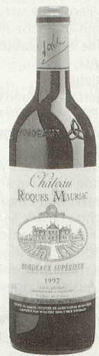
Château Roques-Mauriac Bordeaux superieur AC rot 1997

Gereiftes Rubin, angenehm würzige Reife aromen von Dörrfrüchten, von mittlerer Fülle, rund und mild. (Listenpreis CHF 10.80)