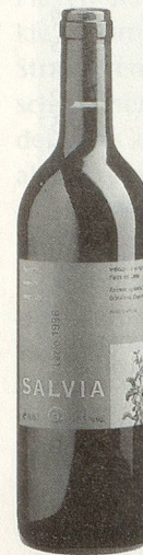
Salvia Lazio IGT rot 1996

Strahlendes Rubin, betörendes Frucht- und Beerenbukett, vollmundig im Gaumen, langer Abgang. (Listenpreis CHF 12.50)