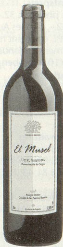
El Musol Utiel-Requena DO rot 1998

Kirschrot, würzig-fruchtiges Bukett, kräftiger Gaumen, ein klassisch ausgebauter Chianti, passt ausgezeichnet zu Pasta. (Listenpreis CHF 13.80)