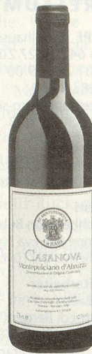
Casanova Montepulciano d'Abruzzo DOC rot 1998

Mittleres Kirschrot, Röstaromen wie Kaffee und Vanille, elegante Gaumenfülle, langanhaltender Abgang. (Listenpreis CHF 14.50)