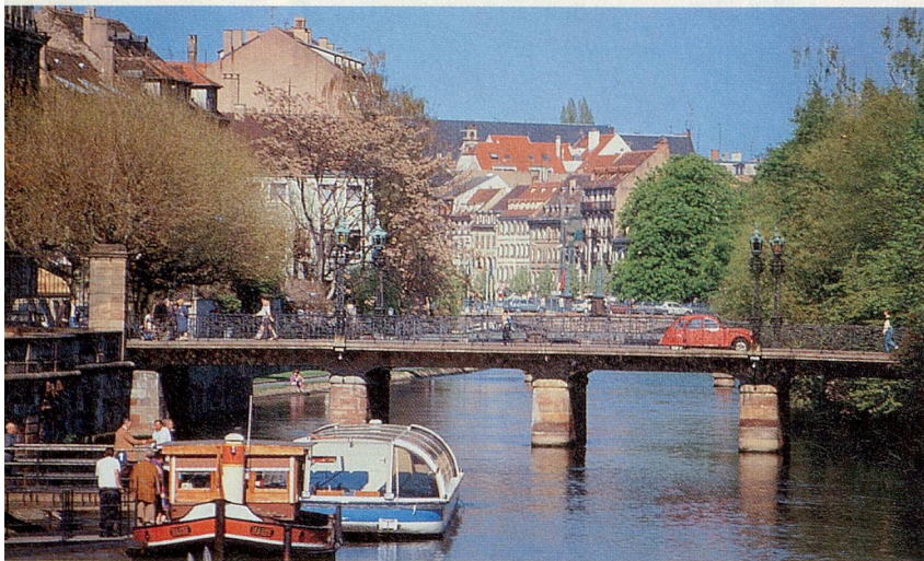
Die Elsässer Wasserstrassen führen auch durch malerische Städte, wie hier durch Colmar.

Eine abwechslungsreiche Herbstfahrt offeriert der Flussfahrten-Spezialist Flotel-Tours von Colmar aus auf dem Grossen Elsässer-Kanal und dem ursprünglichen Rhein-Rhone-Kanal nach Strasbourg. Von dort führt die Reise auf dem in den 60-er Jahren modernisierten Rhein-Marne-Kanal, auf dem man nach Durchfahrt von zwei Tunnels die Hochebene von Lothringen erreicht. Zu den vielen Sehenswürdigkeiten gehören nebst der Fachwerk-Stadt Colmar mit dem berühmten Isenheimer Altar von Matthias Grünewald das malerische Winzerörtchen Riquewahr, die märchenhafte Hochkönigsburg, die Europametropole Strasbourg, die Rosenstadt Savene und die Lothringer Kleinstadt Sarrebourg mit der Kapelle Cordeliers und ihrem weltberühmten Glasfenster «Der Friede» von Marc Chagall. Gefah-