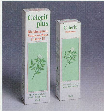
Schutz vor Pigmentflecken

Ihr gepflegtes und attraktives Aussehen ist Ihnen wichtig. Wären da nur nicht diese ärgerlichen Flecken auf Ihrer Haut. Grund genug, jetzt etwas gegen Pigmentflecken zu tun. Fragen Sie deshalb nach Celerit. Diese zuverlässige und sanft wirkende Creme wird bei Pigmentflecken von Fachpersonen empfohlen. Und das mit gutem Grund, denn Celerit bedient sich eines Fünffach-Wirkkomplexes von Aktivstoffen, die sich ideal ergänzen. Vitamin C und Bleichkresseextrakt hemmen die Entstehung neuer Pigmentflecken und fördern gleichzeitig den Abbau bestehender Flecken. Vitamin E beschleunigt den Abtransport überschüssiger Pigmente. Dexpanthenol dient der Rege-