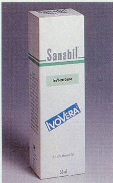
Feuchtigkeits-spender für die trockene Haut

Trockene Haut wird bei warmem Wetter und bei starker Sonneneinstrahlung zusätzlich strapaziert. Es wird ihr die für ihre Schutzfunktion notwendige Feuchtigkeit entzogen. Die Haut wird spröde, verliert ihre natürliche Spann-