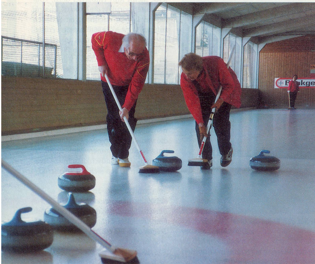
Veteranen des Curling Clubs Küsnacht ZH beim vollen Einsatz.

Text und Foto von Erwin A. Sautter-Hewitt