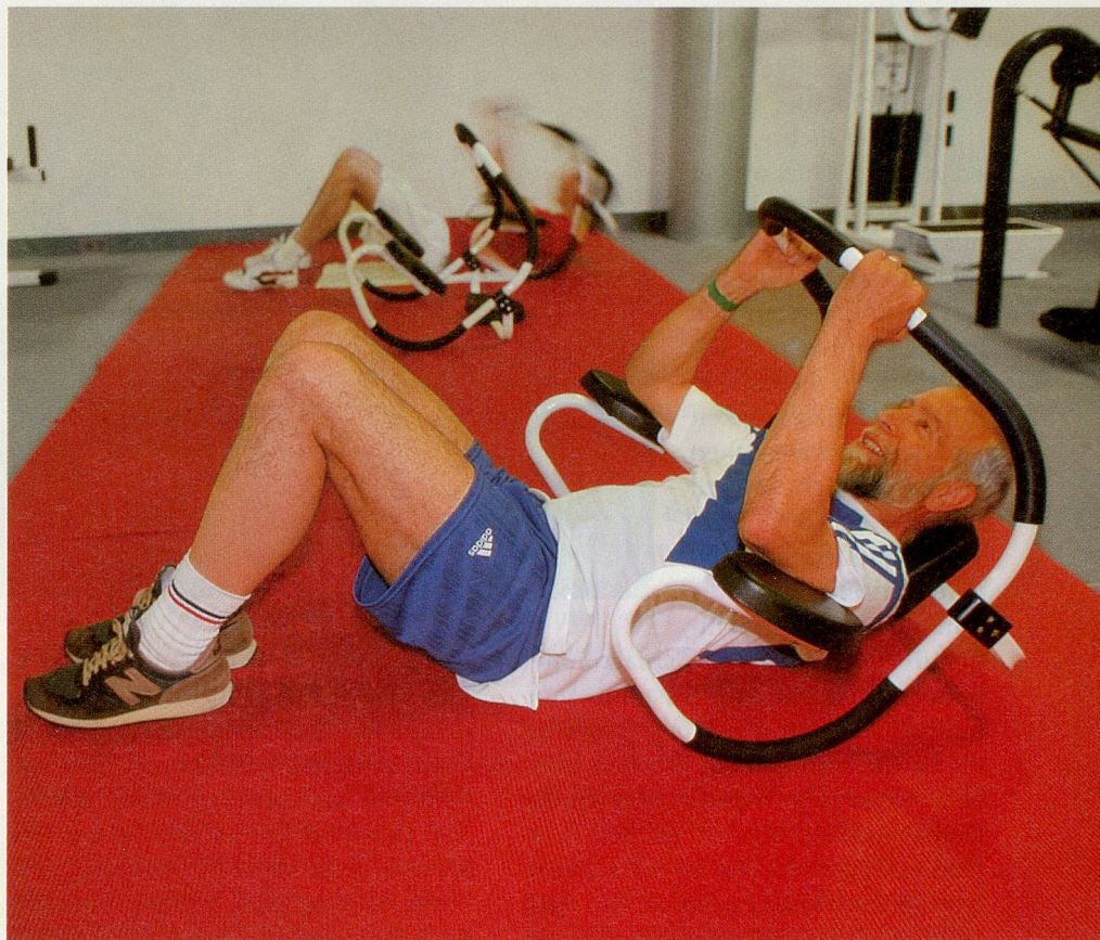
Turnen in der Gruppe soll Spass bereiten und nicht überfordern.