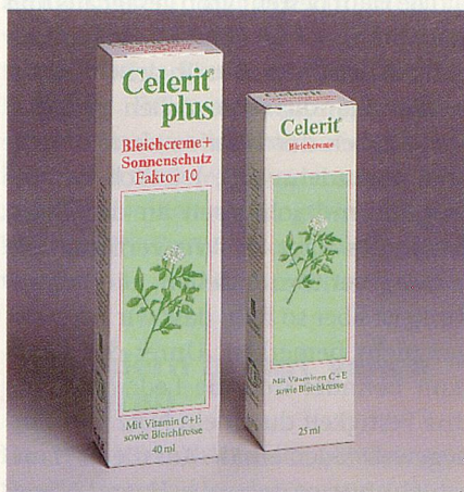
Schutz vor Pigmentflecken.

Ihr gepflegtes und attraktives Aussehen ist Ihnen wichtig. Wären da nur nicht diese ärgerlichen Flecken auf Ihrer Haut. Grund genug, jetzt etwas gegen Pigmentflecken zu tun. Fragen Sie deshalb nach Celerit. Diese zuverlässige und sanft wirkende Creme wird bei Pigmentflecken von Fachpersonen empfohlen. Und das mit gutem Grund, denn Celerit bedient sich eines Fünffach-Wirkkomplexes von Aktivstoffen, die sich ideal ergänzen. Vitamin C und Bleichkresseextrakt hemmen die Entstehung neuer Pigmentflecken und fördern gleichzeitig den Abbau bestehender Flecken. Vitamin E beschleunigt den Abtransport überschüssiger Pigmente. Dexpanthenol dient der Rege-