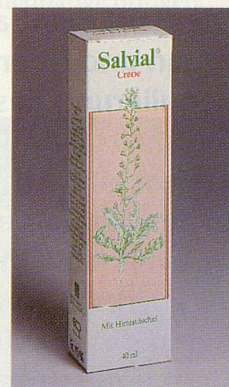
Unterstützt die Durchblutung der Haut.

Rote Hautflecken und durchschimmernde Äderchen sind meistens auf eine Erweiterung bzw. Erschlaffung der Hautgefässe zurückzuführen. Diese Störungen sind zwar harmlos, beeinträchtigen aber Ihr Aussehen und Ihr Wohlbefinden. Der in Salvia Creme enthaltene Hirtentäschel-Extrakt (Capsella bursa pastoris) hat eine gefässaktivierende Wirkung und gibt den feinen Hautgefässen den natürlichen Tonus zurück. Durchschimmernde Äderchen sind oft auch Zeichen einer zu dünnen oder zu trockenen Haut. Zur Unterstützung der Therapie empfiehlt sich daher die Verwendung der Sanabil Ivo Vera Creme. Die Haut wird dadurch fester, und die Äderchen schimmern nicht mehr oder weniger durch. VSM