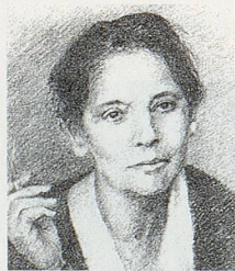
Zum «Erinnern Sie sich noch?» aus Heft 11/97

Schicken Sie die vollständige Bezeichnung des Ereignisses , welches zum Rücktritt von Präsident Nixon geführt hat, und senden sie diese bis am 25. Februar 1998 auf einer Postkarte an: Zeitlupe, Rätsel, Postfach, 8099 Zürich.