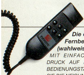
Die elektrische Fernbedienung (wahlweise):

MIT EINFACHEM FINGER- DRUCK AUF EINE DER VIER BEDIENUNGSTASTEN KÖNNEN SIE DIE NEIGUNG DER RÜCKEN- LEHNE ODER DES SITZES IHRES SESSELS NACH BELIEBEN VERÄNDERN.