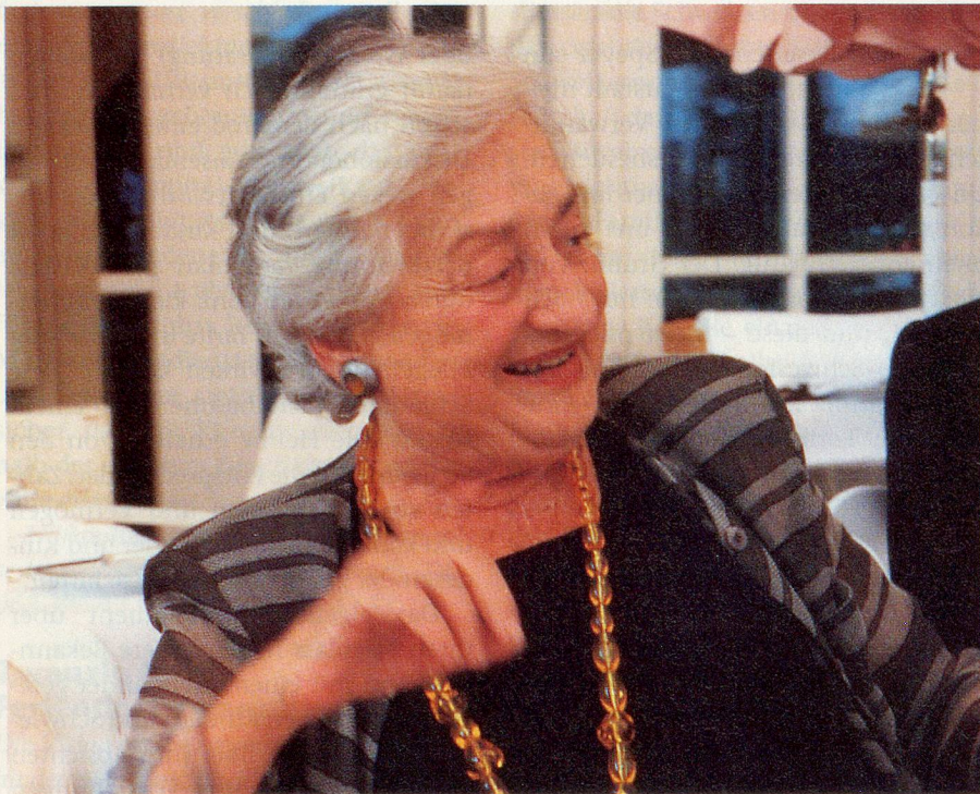
Sie bekomme heute als 77jährige mehr Komplimente für ihr markantes Gesicht als in der Jugend, freut sich Betty Friedan. Und optimistisch wie sie ist, sieht sie darin den Beginn eines Wertewandels in der Gesellschaft.