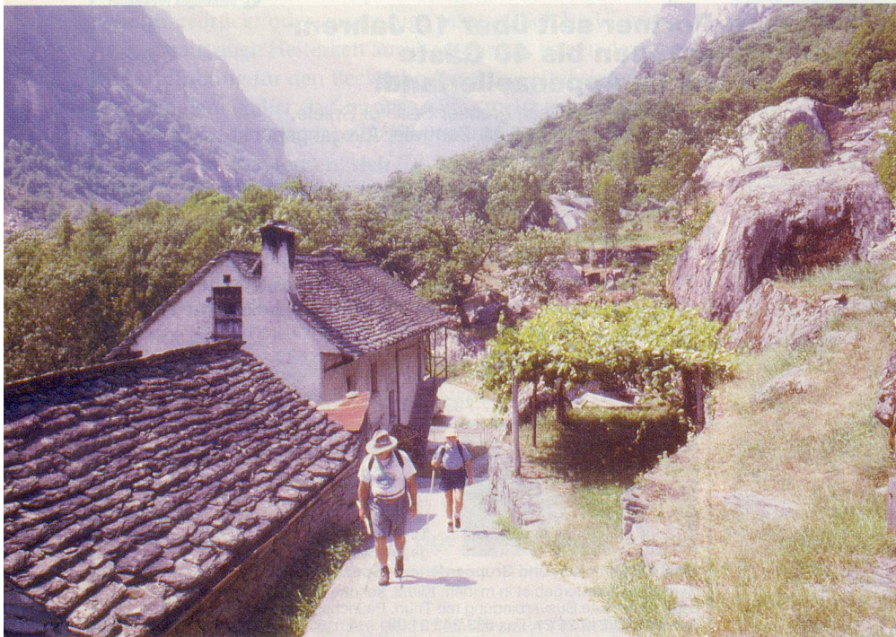
Unbelastet unterwegs auf dem «Sentiero del Sole».