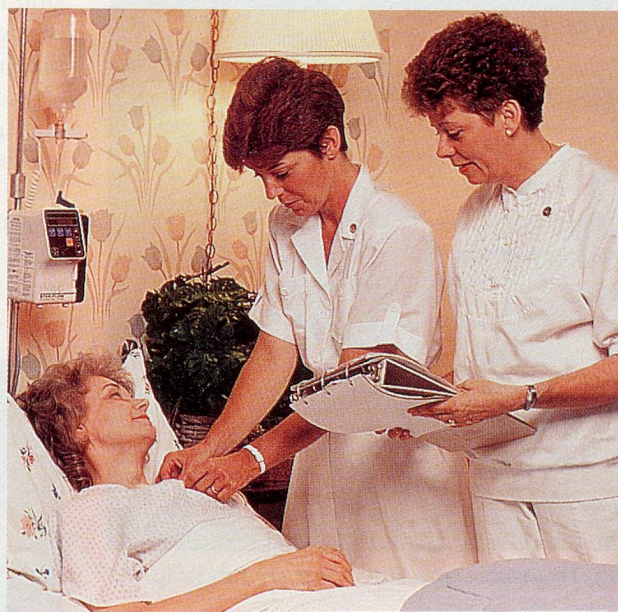
«Das Wesentliche ist, dass man am Heilen Freude hat. Dann sind auch Fragen rund um den Patientenwillen und selbst gewisse «Eskapaden» nicht allzu tragisch zu nehmen.»

Ärgern tut sich aber der Arzt, wenn ein «Wille» aus Unwissenheit kundgetan wird und dem Arzt damit in seine Arbeit, die auszuüben er in einem langjährigen anspruchsvollen Studium erlernt hat, dreingeredet wird. «Da gab es