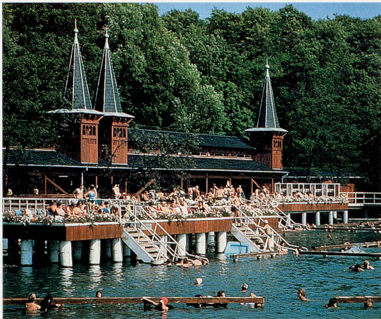
Thermalsee Hewiz in Ungarn