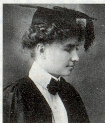
Zum «Erinnern Sie sich noch?» aus Heft 12/96

Aus den richtigen Antworten ziehen wir fünf Gewinner, unter welchen wir einen Blumenstrauss (gestiftet von Winterthur-Versicherungen) und vier Abonnemente der Zeitupe zum Weiterverschenken verlosen.