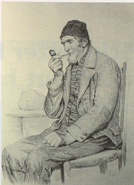
Illustration von Albert Anker aus dem Buch «Käserei in der Vehfreude».

Eine besonders positive, geradezu idyllisch anmutende Geschichte von Gotthelf über einen älteren Mann ist die Erzählung «Der Sonntag des Grossvaters». Die Beziehung zwischen der Schwiebertochter «Kätheli» und dem Grossvater ist besonders herzlich. Der weise, lie-