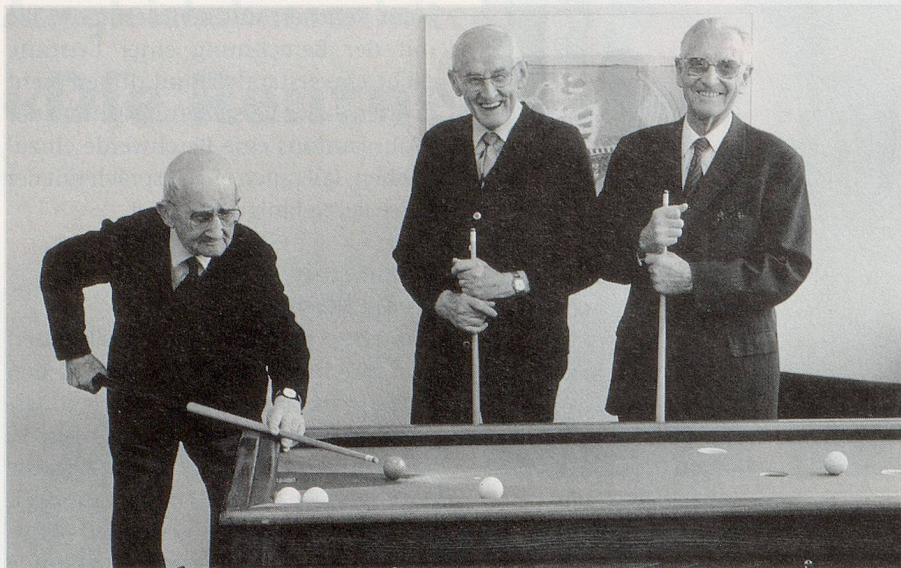
Viele der heutigen Rentner haben gut lachen. Um die AHV auch in Zukunft zu sichern, müssen noch einige wichtige Entscheide gefällt werden.

nun auf, dass die Anfragen vermehrt von jungen Menschen kommen, was früher kaum der Fall war. «Wer dachte denn früher schon mit 25 an seine Rente? Es hat hier ganz klar eine Sensibilisierung stattgefunden, die jedoch sicher auch damit zusammenhängt,