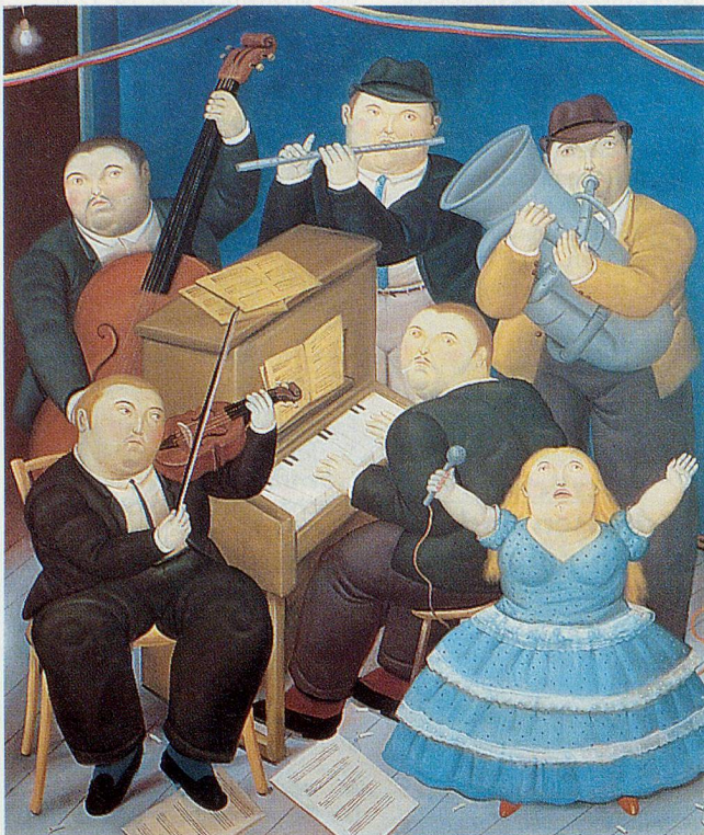
Fernando Botero, «The Orchestra», 1991

An ihren überquellend üppigen Formen sind die Werke Fernando Boteros leicht zu erkennen. Alle Gestalten, die er malt oder als Skulptur verwirklicht, weisen diese übertrieben rundliche Fülle auf. Der Zweck der Deformation besteht nach Aussage des kolumbianischen Künstlers darin, die sinnliche Seite des Lebens zu verherrlichen. Auch geht es ihm darum, die Figuren durch einen kuriosen und verwunderten Ausdruck zu beseelen, der an den Blick eines naiven Kindes erinnert, das die Welt entdeckt. Fernando Botero wurde 1932 in Medellín geboren und kam schon in der Kindheit in Kontakt mit der präkolumbianischen Kunst. Der Frühbegabte liess sich aber auch von der kolonialen Kunst der spanischen Kirchen und von Picasso beeinflussen. Nachdem er knapp 20jährig nach Europa auswanderte, wurde er von spanischen und italienischen Renaissance-Künstlern und von Goya inspiriert. So landete er schliesslich bei seinen fülligen Figuren, die heute in den bedeutendsten Museen der Welt Millionen von Besuchern anlocken. Das Museo d'Arte Moderna in Lugano präsentiert noch bis zum 12. Oktober eine grosse Botero-Ausstellung, die sowohl seine