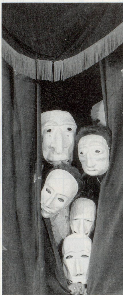
Das Personal des «Aaheims» fertigte die Masken an.