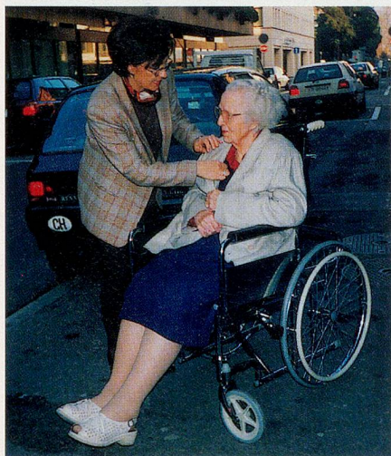
Es ist Abend, bald kommt der neue Bus und fährt die Patientin heim.

Die Gelegenheit zu einem Mittagschläfchen wird wenig in Anspruch genommen, viel lieber sitzen die Grüppchen beisammen und warten,