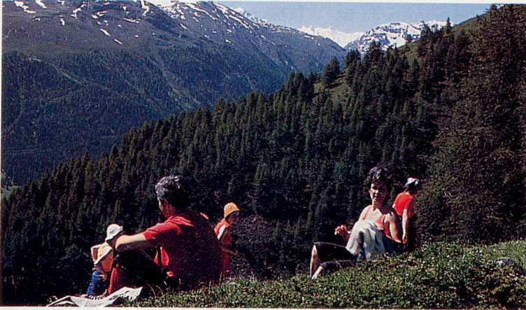
Die schöne Engadiner Bergwelt lädt zum Entdecken und Verweilen ein.