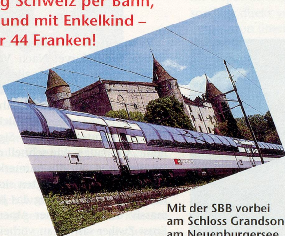
Mit der SBB vorbei am Schloss Grandson am Neuenburgersee

Ein Tag Schweiz per Bahn, Schiff und mit Enkelkind – für nur 44 Franken!