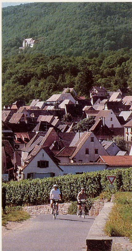
Erholung bei Radfahren und Schlemmen im Elsass.

Auch in diesem Jahr lockt «La Bicyclette Gourmande» zum Einsteigen oder Umsteigen aufs Velo. Der Elsässer Veranstalter bietet Veloreisen auch für Ungeübte mit Aufhalten in ganz besonders charmanten Hotels und – wie der Name La Bicyclette Gourmande sagt – in ausgewählten Gourmet-Restaurants an. Die bisherigen Arrangements führten durchs Elsass, nach Italien, Luzern und ins Berner Oberland. «Ich habe schon viele Veloreisen in