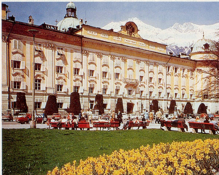
Die Hofburg in Innsbruck.