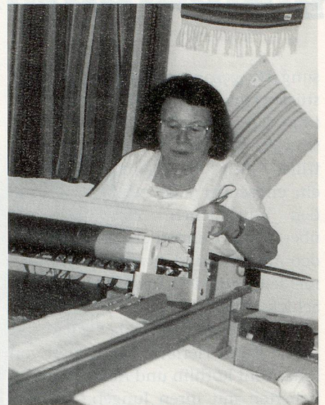
Weben an der Hobbyausstellung in Hausen a/A.