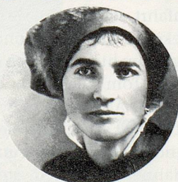
Emma Kunz, 1892–1963 Forscherin, Heilpraktikerin und Künstlerin Entdeckerin von AION A

Immer mehr Ärzte, Physiotherapeuten, Heilpraktiker, Masseure und Krankenschwestern setzen das Würenloser Heilgestein (Pulver) AION A erfolgreich ein bei rheumatischen Erkrankungen, bei Entzündungen, Sportverletzungen, Unfallfolgen usw. Lernen Sie die erstaunlichen Erfahrungen und für jedermann einfache Anwendung dieser Naturtherapie kennen – in einem interessanten Tagesseminar (9–17 Uhr). Verlangen Sie umgehend die Unterlagen.