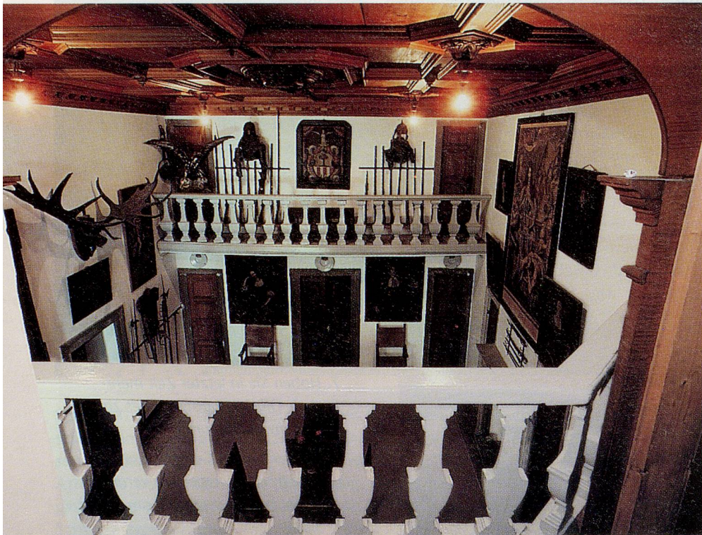
Im Innern des «Hauses von Salis» in Soglio.