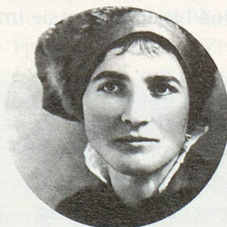
Emma Kunz, 1892 – 1963 Forscherin, Heilpraktikerin und Künstlerin Entdeckerin von AION A

Sich intensiv auseinanderzusetzen mit Naturheilmitteln und einem neuen Gesundheitsbewusstsein, wird immer wichtiger. Wir leben in einer Zeit, wo sich die Menschen neu orientieren und sich auf die Werte der Natur und ihre Heilkräfte besinnen. Das Würenloser Heilgestein (Pulver) AION A nimmt in diesem Prozess einen wesentlichen Platz ein. Wir vermitteln Ihnen in Tages-Seminaren das nötige Wissen über die AION A-Therapie bei rheumatischen Erkrankungen, Entzündungen, Sportverletzungen, Unfallfolgen usw. Die Naturkraft von AION A kann Ihr Leben positiv verändern!