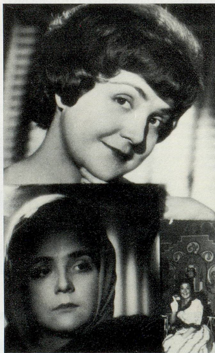
Fotos aus früheren Zeiten

Nein, am liebsten wäre ich Ärztin geworden, doch ich durfte nicht ans Gymnasium, weil da kein «Handarbeiten» unterrichtet wurde. So besuchte ich nach der Sekundar- die Töchterhandelsschule in Bern. Als ich dann realisierte, dass die Bürotätigkeit – mindestens für Frauen – aus acht Stunden Schreibmaschinenschreiben bestand, entschloss ich mich zur Gesangsausbildung, was sich mit meiner Teilzeitstelle beim Bund gut kombinieren liess.