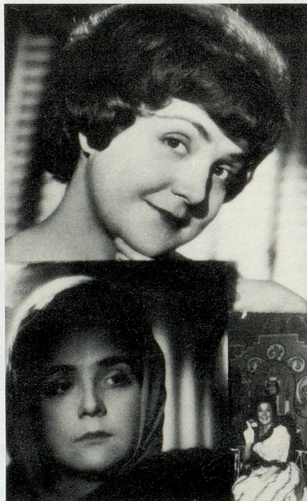
Fotos aus früheren Zeiten

Nein, am liebsten wäre ich Ärztin geworden, doch ich durfte nicht ans Gymnasium, weil da kein «Handarbeiten» unterrichtet wurde. So besuchte ich nach der Sekundar- die Töchterhandelsschule in Bern. Als ich dann realisierte, dass die Bürotätigkeit – mindestens für Frauen – aus acht Stunden Schreibmaschinenschreiben bestand, entschloss ich mich zur Gesangsausbildung, was sich mit meiner Teilzeitstelle beim Bund gut kombinieren liess.