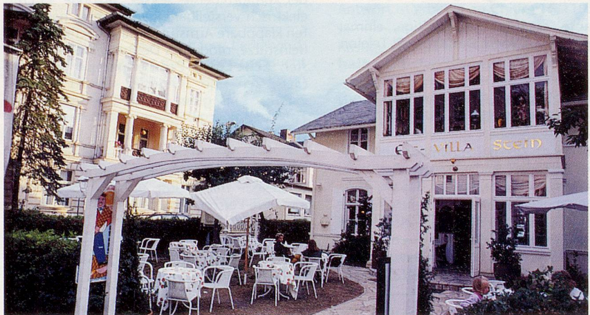
Gasthäuser und Villen aus dem 19. Jahrhundert prägen das Strassenbild.

Stattdessen wurden viele, zu DDR-Zeiten dem Zerfall preisgegebene Herrschaftshäuser und Hotelbauten aus prunkvoller Vergangenheit wieder re-