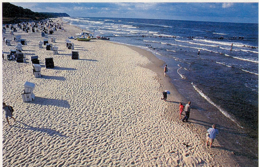
Acht Kilometer feinsandiger Strand, von Ahlbeck über Heringsdorf bis nach Bansin.